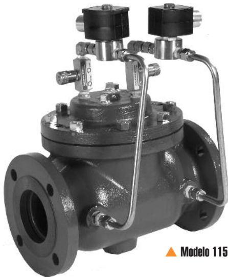
▲ Modelo 115-3

El Modelo 115-3 posee una amplia gama de aplicaciones: es útil en cualquier lugar en el que sea necesario posicionar una válvula eléctricamente. Algunos ejemplos típicos incluyen: