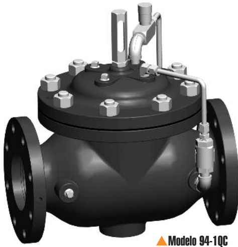
▲ Modelo 94-1QC