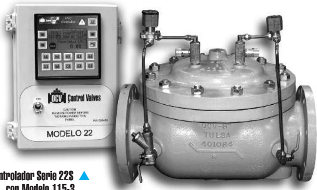
Controlador Serie 22S con Modelo 115-3

La válvula electrónica de mantenimiento de flujo/presión inversa modelo 22S brinda al usuario un control de la presión con una estabilidad extrema sobre una amplia gama de flujos. Combinando las ventajas de la simplicidad y la operación con presión de línea con las características del control electrónico, la válvula puede enlazarse con sistemas SCADA para brindar control remoto y una lógica variable programable. La característica electrónica permite una amplia gama de operaciones, lo cual simplifica el calibrado de la válvula.