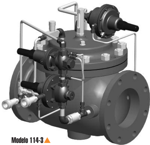
Modelo 114-3 ▲

El modelo 114-3 de OCV es una válvula de control especialmente diseñada para el servicio de reabastecimiento de combustible en aeronaves. Conocida como una válvula de control de reabastecimiento o hidrante, esta es la clásica válvula de control utilizada en los sistemas de reabastecimiento de combustible pantógrafos. Realiza las siguientes funciones: