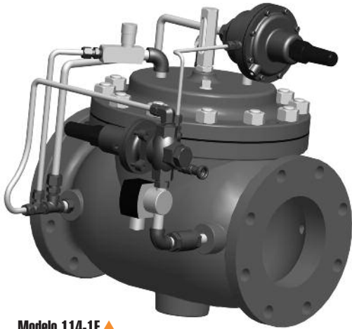
Modelo 114-1E ▲