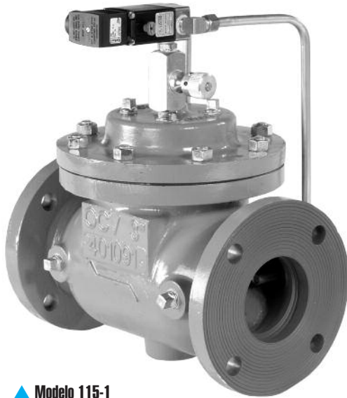
▲ Modelo 115-1

El Modelo 115-1 posee una muy amplia gama de aplicaciones es útil en cualquier lugar en el cual sea necesario abrir o cerrar una válvula en forma eléctrica. Algunos ejemplos típicos incluyen: