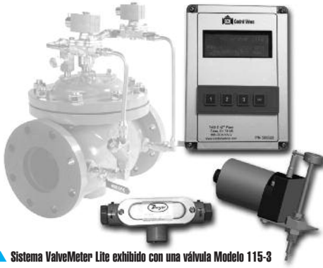
▲ Sistema ValveMeter Lite exhibido con una válvula Modelo 115-3

El ValveMeter Lite (VML) es un sistema electrónico de medición de flujo que puede ser agregado a cualquier válvula de control OCV, en el rango de 4" a 24". Al agregar este sistema, la unidad electrónica permitirá la capacidad de medir el flujo a través de la válvula adaptada. Como resultado, el usuario puede acceder a esta información mediante cualquiera de las siguientes formas: