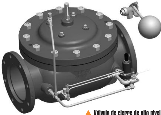
▲ Válvula de cierre de alto nivel Medidas: 6" - 24"

El modelo 8104 se aplica en cualquier sitio donde sea necesario controlar en forma automática el alto nivel de almacenamiento en tanques, donde el piloto de flotación pueda ser montado dentro del tanque.