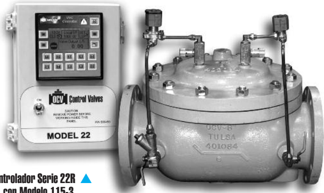
Controlador Serie 22R con Modelo 115-3

La válvula electrónica de control de flujo modelo 22R brinda al usuario un control de la presión con una estabilidad extrema sobre una amplia gama de flujos. Combinando las ventajas de la simplicidad y la operación con presión de línea con las características del control electrónico, la válvula puede enlazarse con sistemas SCADA para brindar control remoto y una lógica variable programable. La característica electrónica permite una amplia gama de operaciones, lo cual simplifica el calibrado de la válvula.