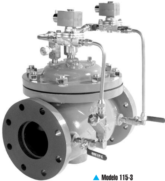
▲ Modelo 115-3

El Modelo 115-3 posee una amplia gama de aplicaciones: es útil en cualquier lugar en el que sea necesario posicionar una válvula eléctricamente.