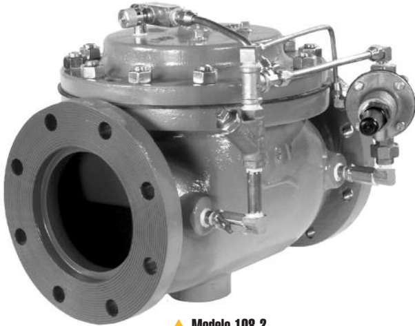
▲ Modelo 108-2

El Modelo 108-2 posee una amplia gama de aplicaciones: cualquier sistema debe estar protegido contra presiones muy altas (escape) o muy bajas (mantenimiento).