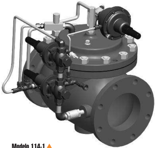
Modelo 114-1 ▲

El modelo 114-1 de OCV es una válvula de control especialmente diseñada para el servicio de reabastecimiento de combustible en aeronaves. Conocida como una válvula de control hidrante o de reabastecimiento de combustible, esta es la clásica válvula de control para sistemas de reabastecimiento de combustible hidrantes, y se utiliza en conjunto con un camión de manguera hidrante o reabastecedor. Realiza las siguientes funciones: