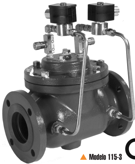
▲ Modelo 115-3

El Modelo 115-3 posee una amplia gama de aplicaciones: es útil en cualquier lugar en el que sea necesario posicionar una válvula eléctricamente.