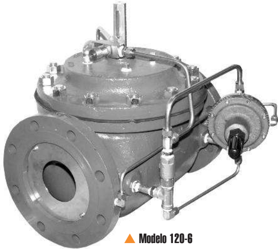
▲ Modelo 120-6

El Modelo 120-6 posee una amplia gama de aplicaciones: en cualquier lugar donde sea necesario controlar o limitar la tasa de flujo y evitar el flujo inverso. Por lo tanto, presenta una aplicación como una válvula de control de descarga de bombas.