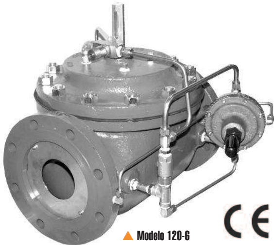
▲ Modelo 120-6

El Modelo 120-6 posee una amplia gama de aplicaciones: en cualquier lugar donde sea necesario controlar o limitar la tasa de flujo y evitar el flujo inverso. Por lo tanto, presenta una aplicación como una válvula de control de descarga de bombas.