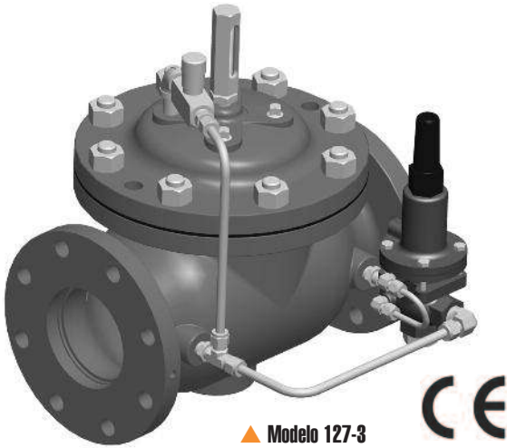
▲ Modelo 127-3

El Modelo 127-3 se aplica en cualquier sitio en que sea necesario reducir la presión a un nivel manejable en sistemas de suministro de combustible.