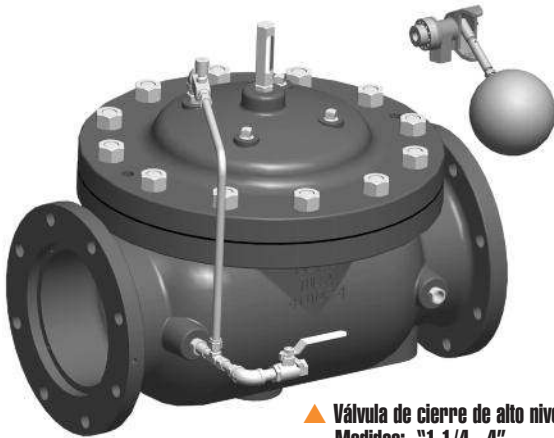
▲ Válvula de cierre de alto nivel Medidas: "1 1/4 - 4"

El modelo 8101 se aplica en cualquier sitio donde sea necesario controlar automáticamente el alto nivel en tanques de almacenamiento donde el piloto de flotación pueda ser instalado dentro del tanque.